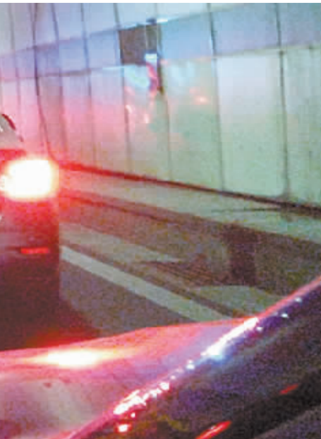
本报记者王熙维用手机拍下了“温暖一幕”

白莲池主变电所第一次初步选址位于更有利于施工建设的驷马桥,但地铁公司充分考虑到该区域为市民集中居住区,为尽量减少对市民生活出行的影响,又将变电站移位至北郊车辆段,但这就使施工进度面临着严峻的挑战。为确保3号线一期工程按期高标准开通试运营,该公司与国网成都供电公司建立了联席会议制度,反复研究停电方案、优化施工流程、压缩施工时间,确保了安全高效地实现供电。